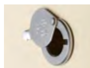
KIJKOOG Verchromd of messing